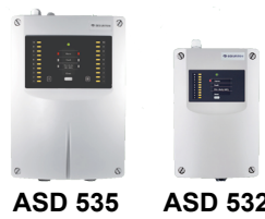
5 ASD 532/535 吸气式感烟火灾探测器 --- 吸气式感烟火灾探测器采样管道