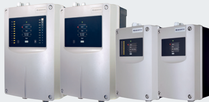
ASD 535-3/4 ASD 535-1/2 ASD 532 ASD 531

来自 Securiton 的吸气式感烟火灾探测器是最可靠的火灾预警系统之一。SecuriSmoke ASD 系列以其无与伦比的性能表现令人印象深刻。瑞士研发，德国制造，性能可靠且强大。